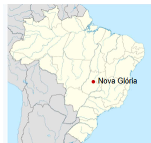
Mapa de localização do Município de Nova Glória – GO